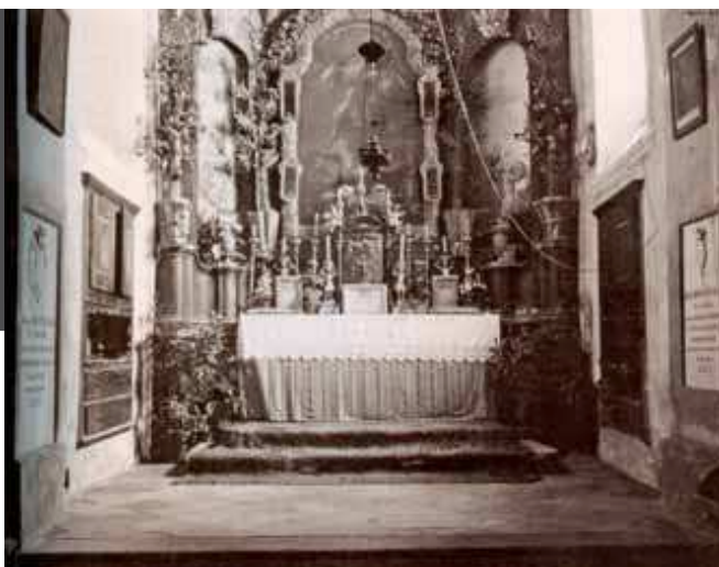
Elizabeta Drašković: Dvorac Bisag, Kapela sv. Florijana (pogled prema svetištu), albumska fotografija, 1904.