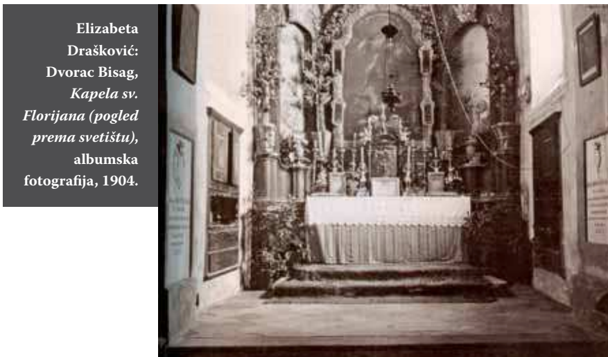
Elizabeta Drašković: Dvorac Bisag, Kapela sv. Florijana (pogled prema svetištu), albumska fotografija, 1904.