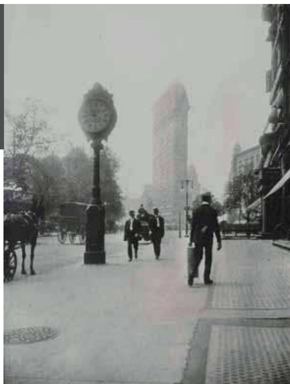
Elizabeta Drašković: New York, Pogled prema Flatironu, najstarijem i najslavnijem neboderu (grad. 1905.), albumska fotografija, 1907.