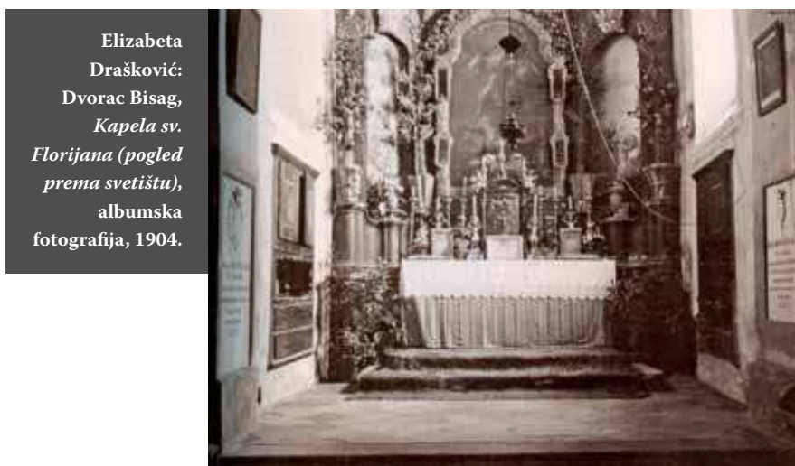
Elizabeta Drašković: Dvorac Bisag, Kapela sv. Florijana (pogled prema svetištu), albumska fotografija, 1904.