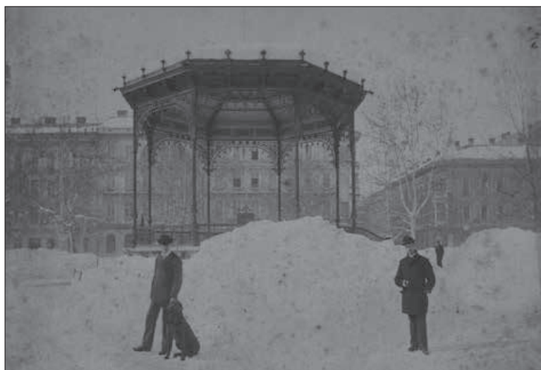
Veliki snijeg na Zrinjvcu, zima 1899./1900., dar inženjera Milana Lenuzija, BHZ 305 /MGZ fot. 8675.

Ocjenjujući potrebnim da se u muzeju sačuva slika starog Zagreba, uveo je narudžbu slika kao način nabave kako bi se sačuvale vizure grada koje su nestale ili im je prijetila opasnost rušenja. Poučen radom u bečkom muzeju predložio je, a gradski načelnik prihvatio 1910. godine, da se za muzej osnuje »Zbirka akvarela zagrebačkih historijskih gradjevina, kakvu posjeduje i bečki muzej«, što je Laszowski potkrijepio tumačenjem »jer nažalost naše historijske gradjevine zagrebačke redom su do danas iščezavale. Tako će se barem mnoge spasiti od zaboravi barem u slici«. 12 Dio posla bio je povjeren »darovitoj umjetnici«, mladoj slikarici Vjeri Bojničić, 13 kćeri Ivana pl. Bojničića,