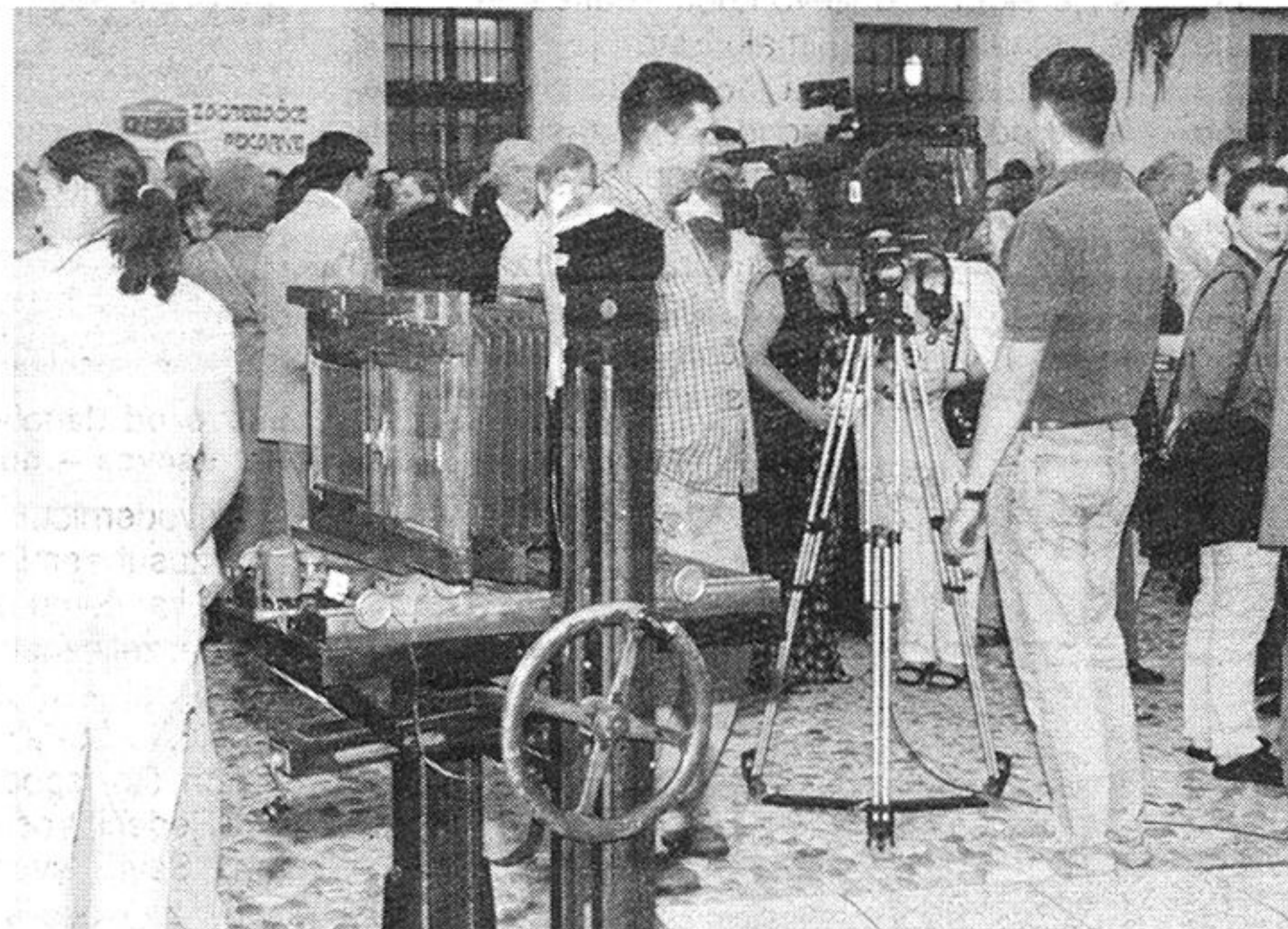
S otvorenja izložbe zagrebačke fotografije u doba Habsburgovaca.

U doba Habsburgovaca javlja se nova građanska inteligencija s drugačijom strategijom i novim programom vođenja kulturnog života, s izrazitim naglaskom i osje-