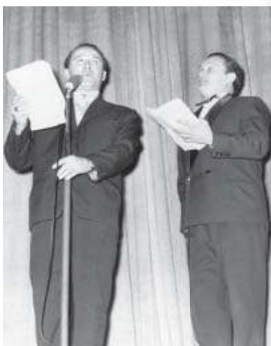
Viki je najčešće surađivao s velikim prijateljem i kolegom Bracom Reissom

Ovu je skladbu na petom Festivalu kajkavske popevke Krapina '70. izveo Vice Vučkov. Riječi Vikija Glovackog uglazbio je Vili Čaklec. Zanimljivo je, međutim, da je zbog počasnog gosta festivala, jugoslavenskog predsjednika Josipa Broza Tita, Glovacki iz političkih razloga morao napraviti dvije promjene u tekstu: »hrvatski dom« je promijenjen u »zagorski dom«, a »taj se nikog ne boji« u konačnoj verziji glasi »taj se ničeg ne boji«.