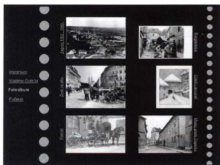
Navigacija kroz fotoalbum prema tematskim cjelinama