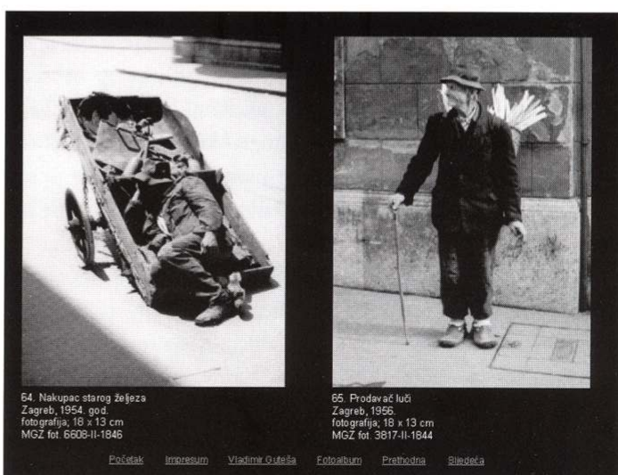
64. Nakupac starog željeza Zagreb, 1954. god. fotografija, 18 x 13 cm MGZ fot. 6608-II-1846