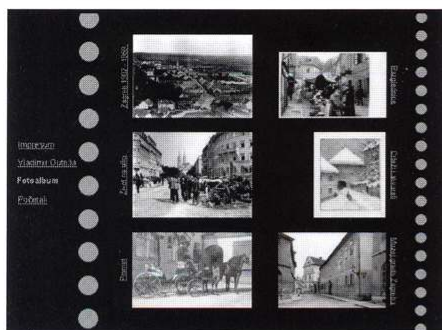
Navigacija kroz fotoalbum prema tematskim cjelinama