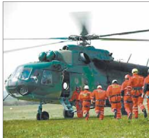
Broj intervencija GSS-a sve je veći