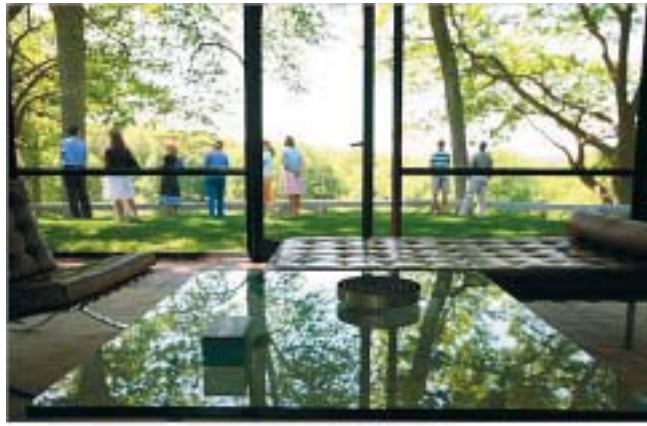
Drveće kao da raste iz kuće