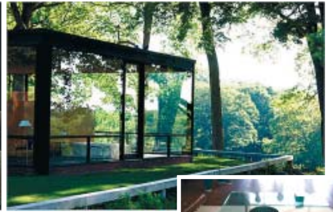
Sumrak u Glass House (gore); i namještaj je većinom staklen (desno)