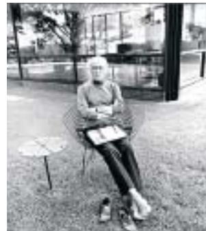
Arhitekt Philip Johnson ispred svoje staklene kuće