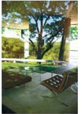
Okoliš se odražava u staklu