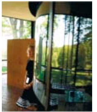
Stakleni zid između dnevne i spavaće sobe