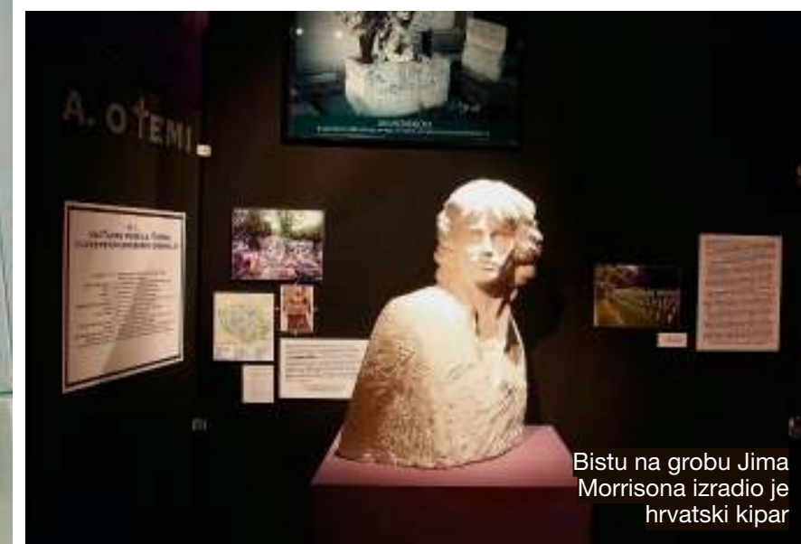
Bistu na grobu Jima Morrisona izradio je hrvatski kipar