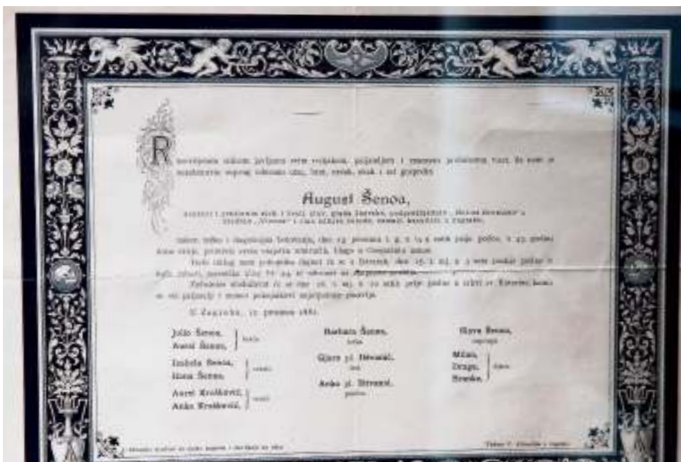
Posmrtna maska napravljena je u čast J. J. Strossmayeru; osmrtnica Augusta Šenoa objavljena je 15. prosinca 1881.