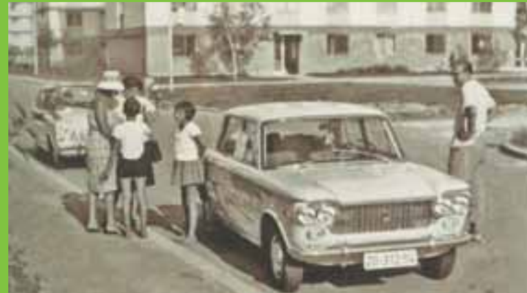
Karakteristična novozagrebačka obitelj pred polazak u grad: Snimak iz 1966. godine