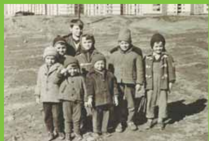
Odrastanje s vlastitim kvartom: S izložbe