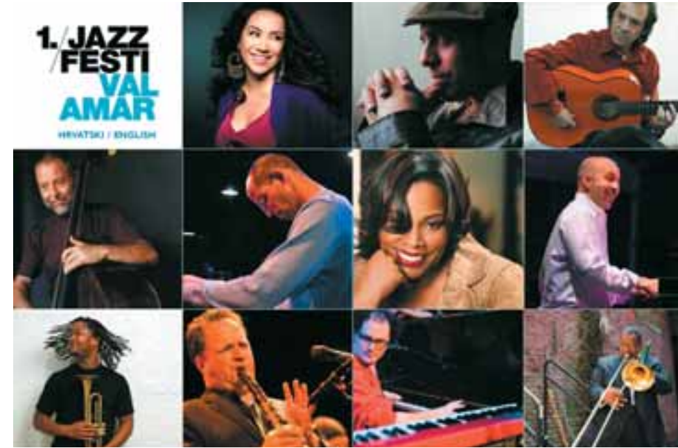
Prvi međunarodni jazz festival u Istri: Valamar jazz festival

Kao odjavu prvoga i najavu drugoga izdanja festivala, pokrovitelji festivala Riviera Poreč i Valamar grupacija poklanjaju građanima i gostima Poreča koncert salsa i afro-kubanske glazbe, postave Samera. Koncert će se uz besplatan ulaz održati na rivi u Poreču 21. kolovoza. [Hrvoje Horvat]