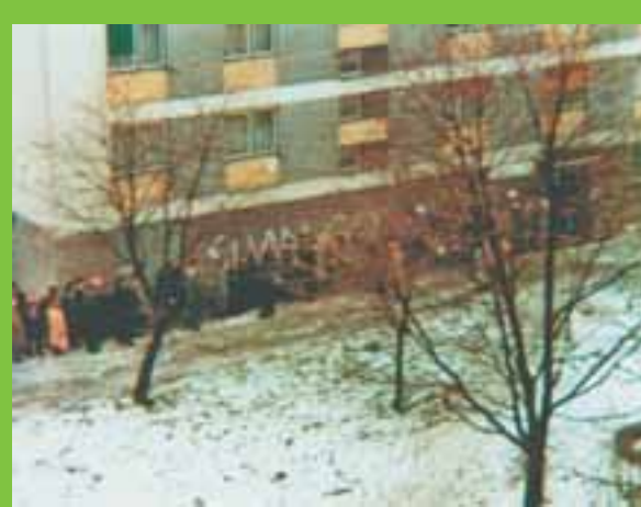
»Bolja« prošlost: Red pred trgovinom u vrijeme nestajanja 80-ih