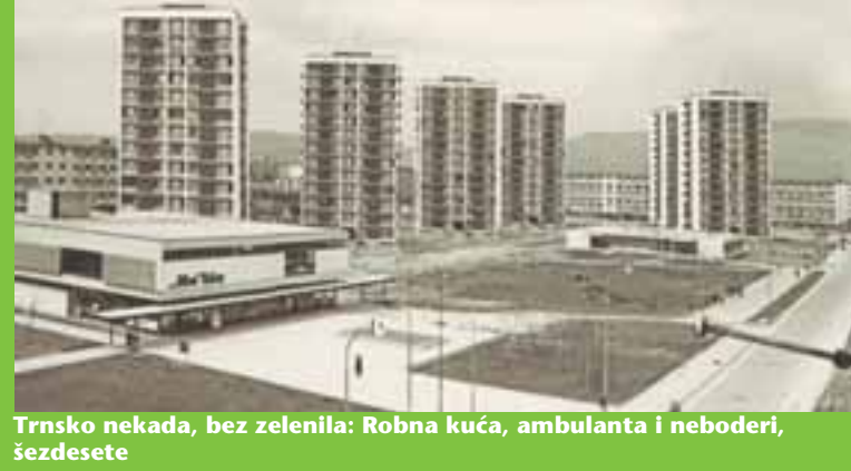
Trnsko nekada, bez zelenila: Robna kuća, ambulanta i neboderi, šezdesete

Prvi Trnskaši odavno su se raselili, što po drugim zagrebačkim četvrtima, što po svijetu. U četvrti danas žive »neki novi klinčci« koji više ne muče muku s dolaskom do grada i nedostatkom noćnih linija, niti nedostatkom zelenila, što je Trnsko u godinama nastanka činilo poprilično odbojnim mjestom za život. Sudeći po onome što se moglo čuti u ponedjeljak na neformalnom okruglom stolu »Kvartovske priče«, zabilježen u audiovizualnom obliku, današnji Trnskaši vole svoj kvart, posebno zbog zelenila što ga, unatoč ružnim i jednoličnim zgradama čini jednim od najhumanijih novijih zagrebačkih kvartova. Ono što muči velik dio Grada, niti tu nije iznimka - prometni problemi te nedostatak parkirnih mjesta. Inače, što se možda manje zna, stanovnici Trnskog i susjednog Sigea su, kao valjda svi susjedi ovoga svijeta, u sporu - kome pripada Park mladenaca koji dijeli dva naselja. Snimljeni materijal pod nazivom postat će sastavni dio fundusa Muzeja grada Zagreba, a dio će biti dostupan i na mrežnim stranicama Virtualnoga zavičajnog muzeja Trnsko, www.trnsko.net i Muzeja grada Zagreba www.mgz.hr .