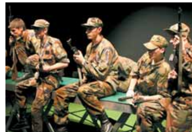
Šeparovićeva »Generacija 91-95« gostuje na MESS-u

Već 17. rujna započinje Festival svjetskoga kazališta i potrajat će 2. listopada, te će, prema riječima Dubravke Vrgoč, u Zagreb dovesti neka od najnovijih i najinovativnijih redateljskih imena današnjice. [Z. Zorčec]