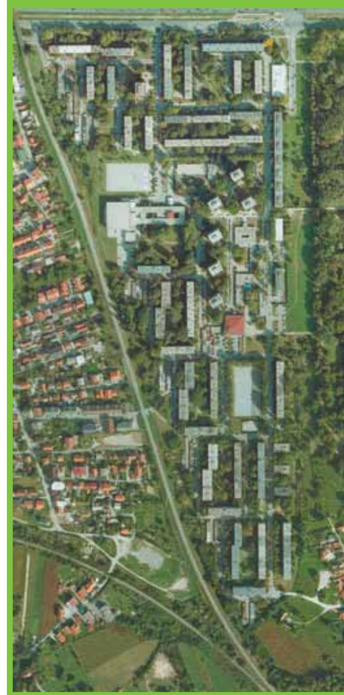
Zelena oaza: Trnsko iz zraka