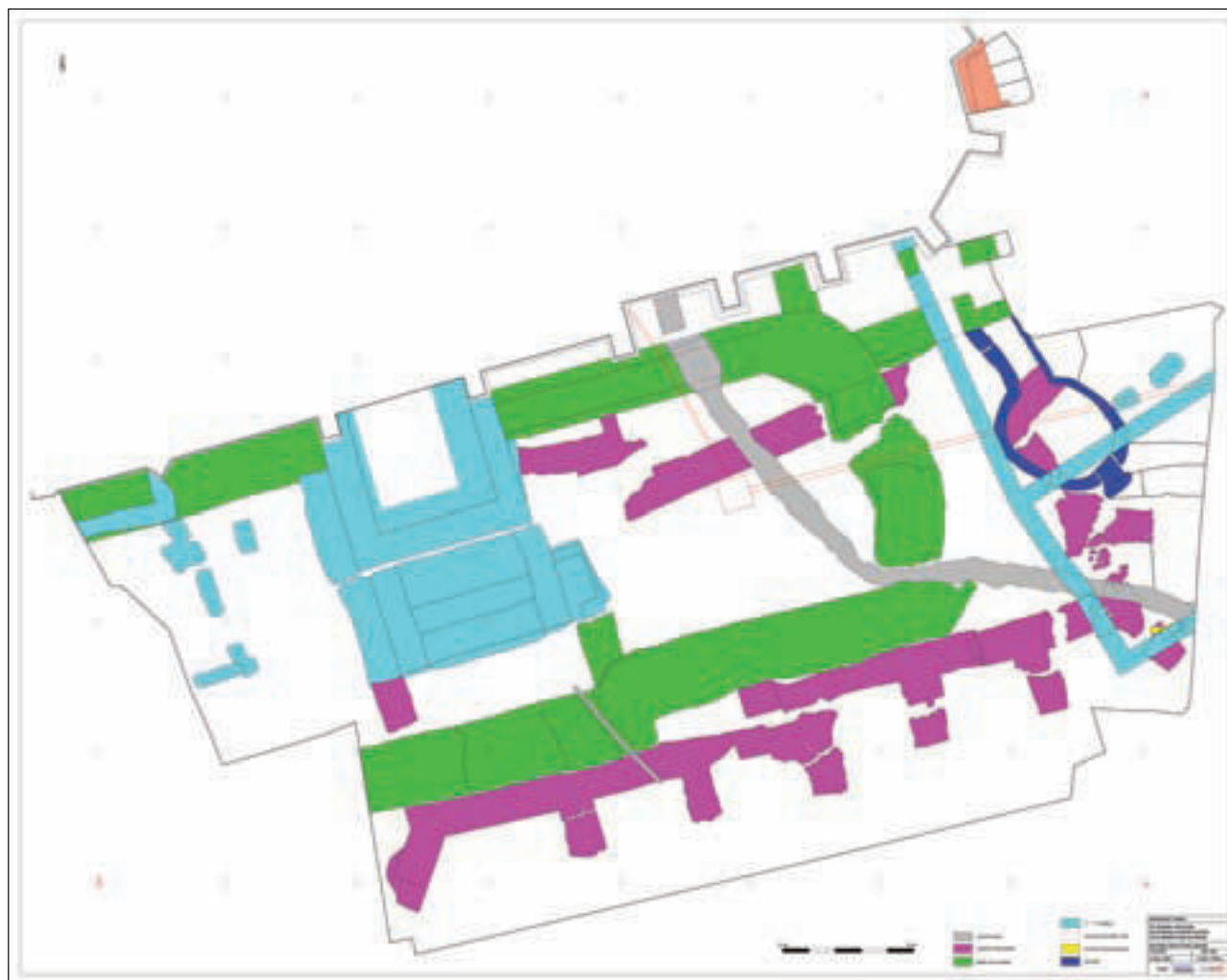
Kompozitni tlocrt otkrivenih arheoloških struktura (Vektra/Geo3D)

Nekada pavlinski, a danas karmelićanski samostan u Remetama, nalazi se u dolini Kratki dol, na južnim obroncima Medvednice, svega 5 km sjeverno od središta Zagreba. Gradnju današnje crkve Blažene Djevice Marije