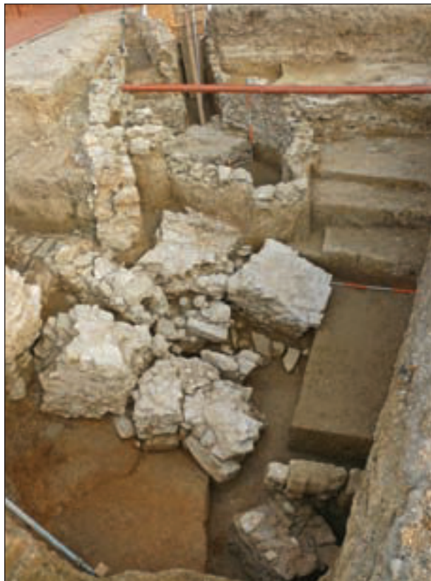
Dijelovi apsida najstarije pronađene crkve s kontraforima i ovalni objekt, jesen 2009.

Iako je navedeni vremenski interval relativno kratak za gradnju triju velikih crkava, treba uzeti u obzir iznimno nepovoljan položaj na aktivnoj točki klizišta koje su pavlini izabrali za gradnju svoga samostanskog sklopa.