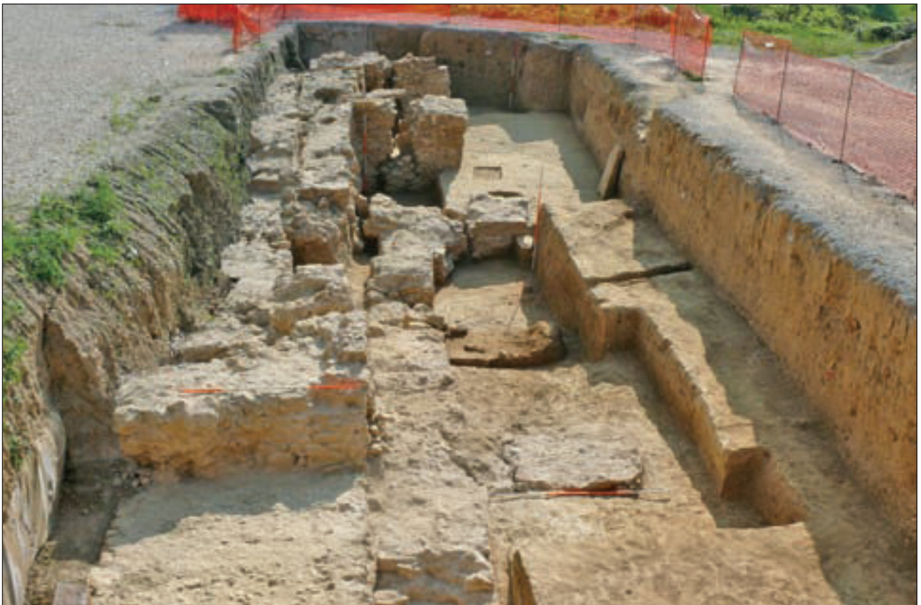
Dio lokaliteta istražen 2009. na južnom dijelu platoa uz crkvu BDM u Remetama

Prema idealnoj rekonstrukciji nastaloj iz 3D-modela, najstarija pronađena samostanska crkva bila je, sukladno uzusima pavlinskog reda, građena kao sakralni objekt naglašene longitudinalnosti, dimenzija 30,40x10,80 m. Pravokutna lađa (13,75x8 m) gotovo je jednake dužine kao i polukružno zaključeno svetište (13,80x6,10 m). Crkva je na svim istraženim slobodnim pročeljima bila ojačana pravokutnim, masivnim kontraforima (18x13 m), koji su izgrađeni u vezu s temeljima. Unatoč brojnim vlačnim pukotinama, južni temelj lađe (širina 1,2 m) nije pretrpio veće tektonske pomake, a djelomice je bio oštećen naknadnim građevinskim intervencijama. Za razliku od njega, začelni temelj svetišta pretrpio je znatne pomake. Uz oštećenja nastala gradnjom mlađe crkve, evidentna je destrukcija zidne strukture izazvana pomicanjem temelja u smjeru putanje šireg prostora klizišta. Sjeverni zid lađe i gotovo