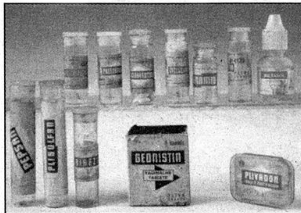
Primjeri stare ambalaže – sada muzejski izložci

Isprva je dr. Rodin sakupljao samo staru ambalažu, no vrlo brzo, shvaćajući je, kako sam kaže, »kao sredstvo za čuvanje, prodaju i uporabu proizvoda kroz koje se zrcali civilizacijski napredak« počinje sakupljati ambalažu bez obzira na vrijeme njezina nastanka.