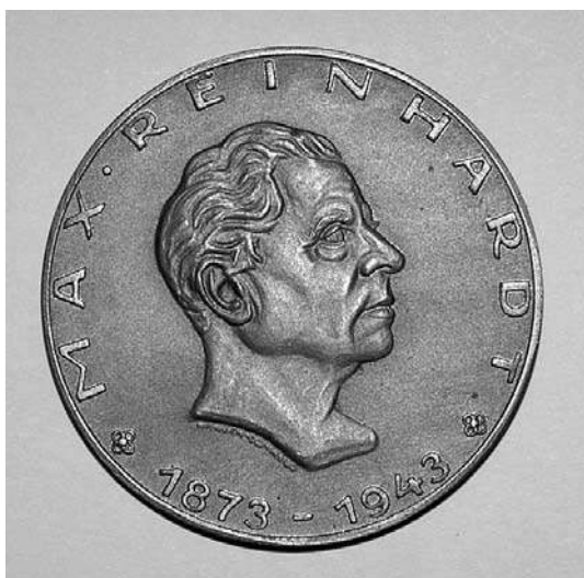
sl.11. Medalja Maxa Reinhardta dodijeljena 1962.