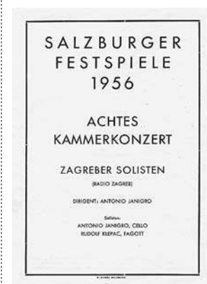
sl.7. Program koncerta sa Zagrebačkim solistima na Salzburškim svečanim igrama 1956.

pokal vlade pokrajine Salzburger Land. 19 Srebrna Mozartova medalja Međunarodne zaklade Mozarteum (Internationale Stiftung Mozarteum) dodijeljena mu je 5. prosinca 1975. za izvrsnu interpretaciju Mozartove glazbe za fagot. 20 Nakon umirovljenja 1978. pa sve do 1992. g. redovito se vraćao u Salzburg kao koncertni umjetnik, dirigent i pedagog