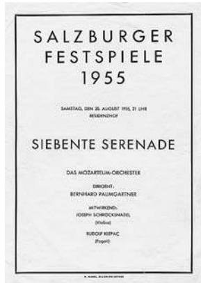
sl.5. Program koncerta na Salzburškim svečanim igrama 1955.