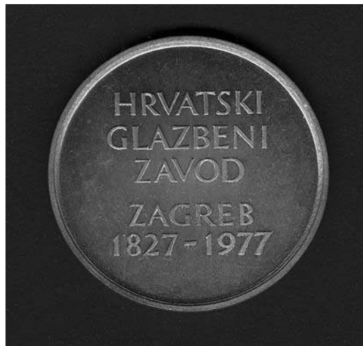
sl.10. Medalja Hrvatskoga glazbenog zavoda 1977.