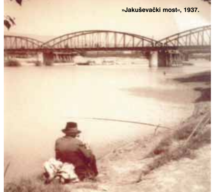
»Jakuševački most«, 1937.

zahvaljujući mom trudu, barem malo uživanja i ljepote kojima se i sam nadam. Nije to samo nada, već i vjera u čudno lijepo, a bez koje bih osjećao samo silan strah od mogućeg nanošenja gubitka osobi