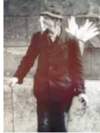
»Prodavač luči«, 1956.

dnu posve novu priču. Možda nam baš taj mali isječak, viđen iz ograde, otkriva velikog čovjeka, znatiželjnog poput njega samog, čovjeka istih ideja i nakana – proviriti, zabilježiti, zapamtiti i trajno virkanjem zabilježiti djeliće života i prošlosti te nastojanja jedne generacije, ili pak sraz među mnogima, ili ono najljepše – dijalog među mnogima. Iza ove pregrade krije se sijaset informacija, bezbroj ljudskih sudbina, a ja odabirem baš to mjesto i baš taj prostor – mali, omeden interesom, posve novim saznanjem, maštovito nei-