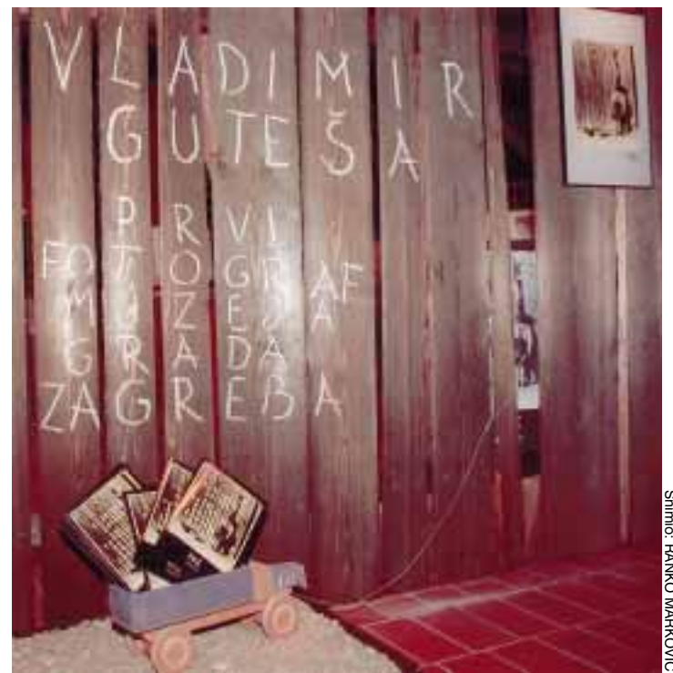
Fotografija »Znatiželja« iz 1937. poslužila je autorima kao ideja za ulaznu instalaciju izložbe fotografija Vladimira Guteše