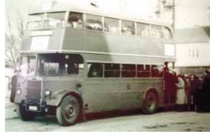
»Autobus Črnomer-Podused«, 1955.

U ponedjeljak se u Multimedijalnoj dvorani Muzeja grada Zagreba otvara izložba fotografija Vladimira Guteše / Njegove fotografije mnogobrojnim stručnjacima i danas predstavljaju izvanrednu podlogu za izučavanje prošlosti Zagreba