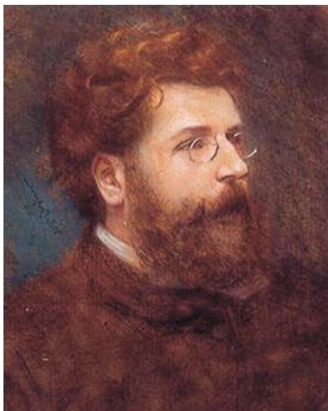
Slika 43. Vlaho Bukovac: Portret Georgesa Bizeta, 1888., pastel na papiru, 510 x 425 mm (iz donacije Vinka Perčića)

Uvjet darovanja bio je zahtjev da se umjetnine izlože kao cjelina te da Zbirka