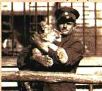
Timaritelji s najmlađim lavčićima, oko 1930.

Zoološkim vrtom. Program igraonice za djecu, kao sastavni dio izložbe, potaknut je igrom – slagalicom Zoološki vrt iz fonda Muzeja koja je bila vrlo popularna, a mogla se kupiti u trgovini Mavre Druckera, Ilica 39, u Zagrebu dvadesetih godina prošlog stoljeća. Izložba se može pogledati do 31. listopada 2015.