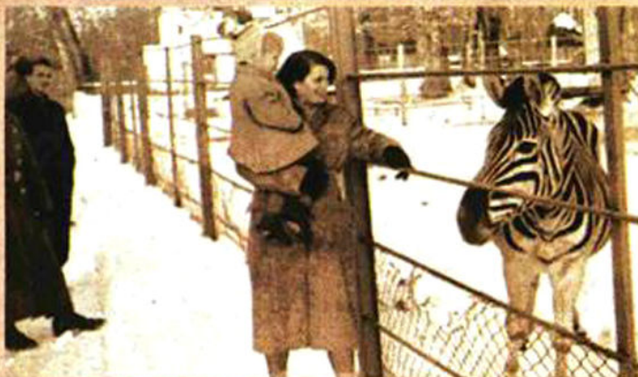
Zebre, deve, timaritelji i posjetitelji, oko 1955.