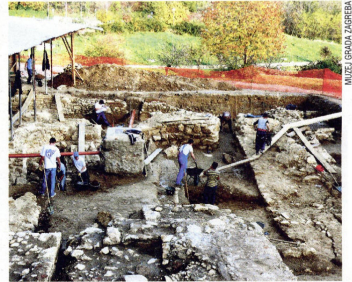
Arheološka iskopavanja uz južni zid remetske crkve

- Tu je, uz našu crkvu, nađen i Korvinov novac. Ta su istraživanja otkriće i za nas. Prema pričama starijih čuli smo da je uz crkvu postojalo groblje, o čemu nismo imali podatke - tumači