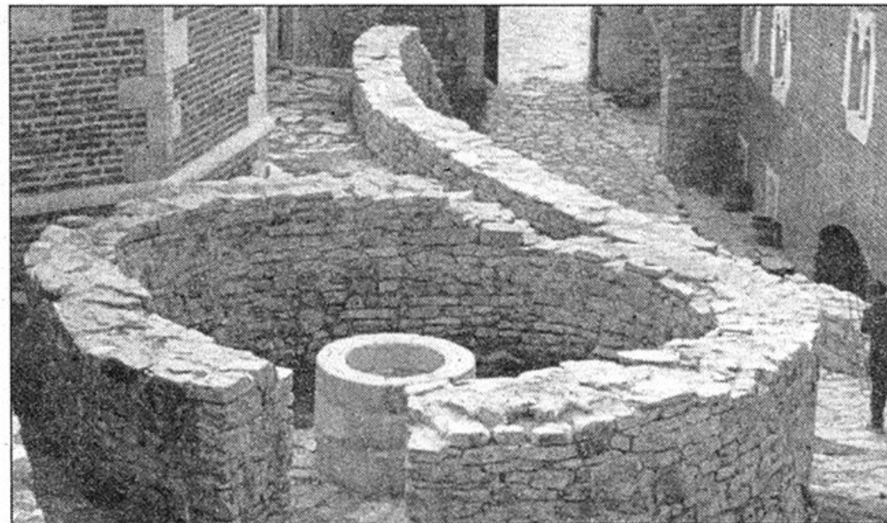
Izgled obnovljenog zdenca

Pojedini primjerci vrčeva bogato su urešeni češljastim ili motivom valovnice.