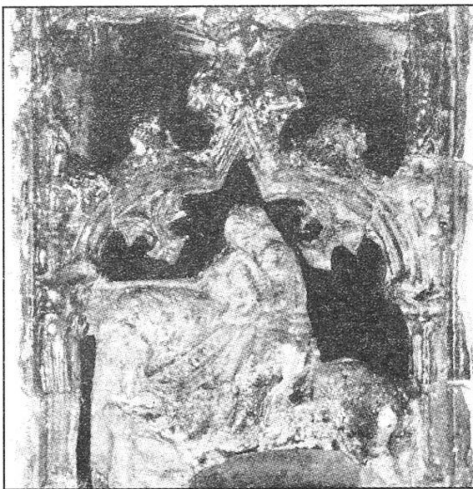
Pećnjak pronađen prilikom arheoloških istraživanja na Novoj Vesi s prikazom viteza na konju

Građevinski radovi unutar urbanih cjelina nerijetko su jedini izvor materijalnih svjedočanstava o povijesti jednoga grada.