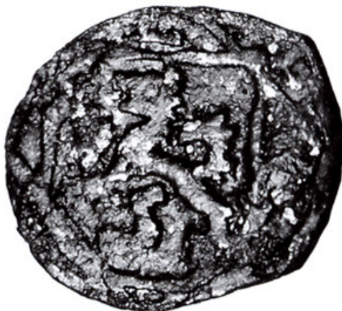
Sl. 1. Jednostrani pfenig

To je srebrni jednostrani pfenig (težina: 0,25 g; promjer: 13 mm). Kontekst njegova nalaza (sl. 2.) sugerira da je u grobnu raku položen zajedno s pokojnikom. Novac je bez oznake godine, kovan između 1518. i 1520., u gradu Passau, u vrijeme bavarskog vojvode Ernesta Bavarskog (1517. – 1554.).