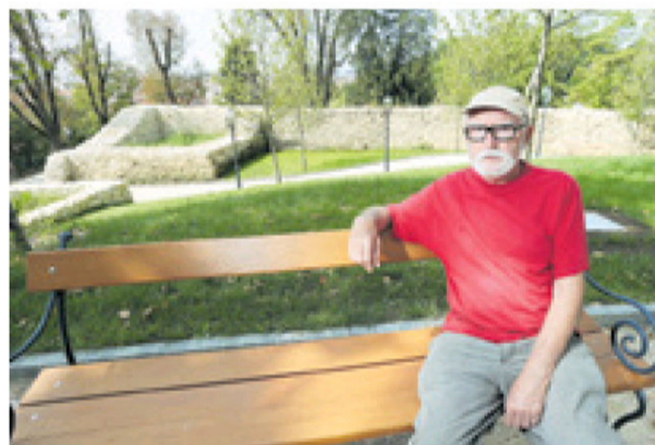
Ostaci zidina otkriveni su u arheološkim istraživanjima

– Originalna fontana autora Ivana Rendića uklonjena je pedesetih, a ostaci su joj u Muzeju za umjetnost i obrt. Repliku je izradila kiparica Zvonimira Obad – govori Hržić dok šćemo parkom, napominjući da je na projektu re-