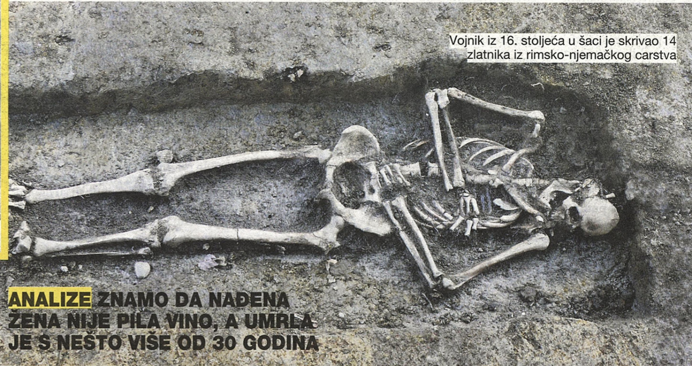
Vojnik iz 16. stoljeća u šaci je skrivao 14 zlatnika iz rimsko-njemačkog carstva

U antropološkoj analizi pokojnika stručnjaci su koristili forenzičke metode kao u CSI serijama. Time su uz CT snimku kompjutorskom obradom uspjeli rekonstruirati lice žene s Gradeca iz 13. stoljeća