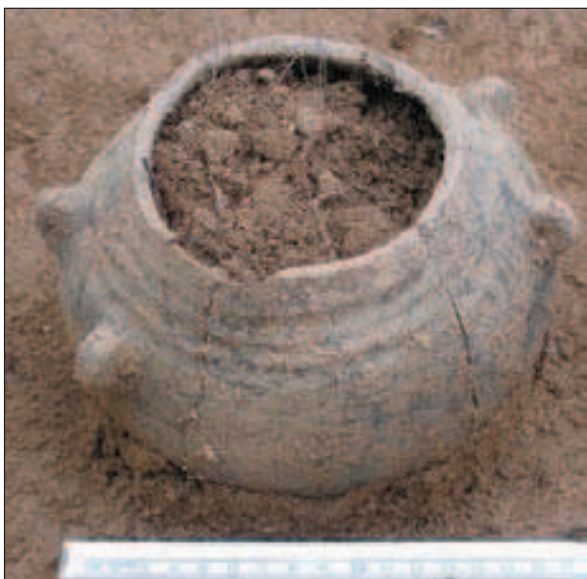
Budinjak, tumul 99, posuda iz groba 2

Grob 1 – središnji i jedini grob u tumulu, orijentacije jug-sjever, duljine 2,5 m, sadržavao je jedan keramički lonac