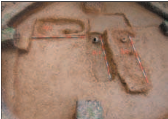
Budinjak, istraživanje tumula 99

grobu činili su jedna duboka i visoka keramička loptasta zdjela te keramički pršljen, najčešći prilog ženskih grobova na budinjačkoj nekropoli.