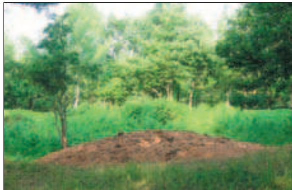
Budinjak, vraćanje tumula 92 u prvobitno stanje

širih istraživanja naseobinskog kompleksa, koji uz nekropolu čini ovo nalazište nezaobilaznim u proučavanju srednjoeuropske halštatske kulture.