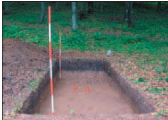
Budinjak, sonda A