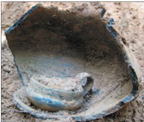
Budinjak, tumul 91, šalica

Prve probne sonde na gradini namjerno su napravljene na njenu rubnom dijelu (sjevernoj strani), za koji se pretpostavilo da nije najbolji položaj za život na gradini. Utvrđena je debljina kulturnih slojeva na tom dijelu gradine te su pronađeni važni fragmenti keramike (među kojima i ručka pekve), koji ponovo upućuju na potrebu