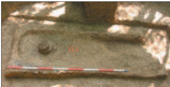
Budinjak, tumul 91 A

ili oružja). Stoga ovi grobovi (uključujući i grob iz tumula 91 A) čine posebnu zanimljivost. Premda se nalaze u samom središtu nekropole grobnih humaka, moguće je da je riječ o nešto nižem staležu pučanstva, pa se tako ta skupina tumula može smatrati veoma važnom pri sagledavanju horizontalne stratigrafije cjelokupnoga grobišta. Osim načina ukopa, riječ je i o prvorazrednim keramičkim nalazima među kojima prednjači loptast lonac iz groba 2, tumula 99, prvi nalaz takva oblika na nekropoli i iznimno rijedak u halštatskoj kulturi. Osim navedenih, novu spoznaju donio je i grob u tumulu 91 A. U prethodnim istraživanjima grobišta nije zabilježen pojedinačan ukop u manjem tumulu. Dosadašnja iskopavanja dopustila su pri načinu ukopa izdvajanje tipa 6 – pojedinačan kosturni grob u većim tumulima (Ø 10 – 15 m). Prvi je put kosturni pojedinačni grob pronađen u tumulu malog promjera (Ø 6 m). To još ne znači da je potrebno nadopuniti sadašnju shemu načina ukopa, no buduća istraživanja zasigurno će ovu iznimku ili potvrditi, što bi rezultiralo nadopunom sheme, ili ostaviti iznimkom. Već je bilo riječi o važnosti keramičkih nalaza iz grobova. Premda kod nekih grobova nije bilo moguće, upravo zbog pomanjkanja metalnih nalaza, sa sigurnošću pretpostaviti pripadnost muškom ili ženskom spolu, možda će se više moći reći nakon restauracije keramike. Naime, jedni su keramički oblici posuda učestaliji u muškim, a drugi u ženskim grobovima.