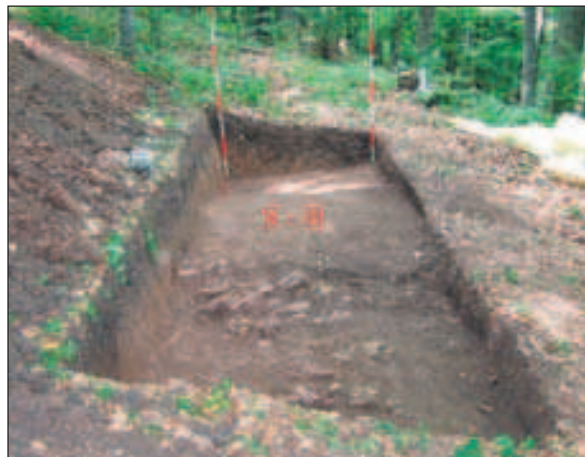
Budinjak, sonda B

Grob 2 – ukopan je paralelno uz grob 1, s njegove južne strane (duljina 2,2 m). Materijalne ostatke pronađene u