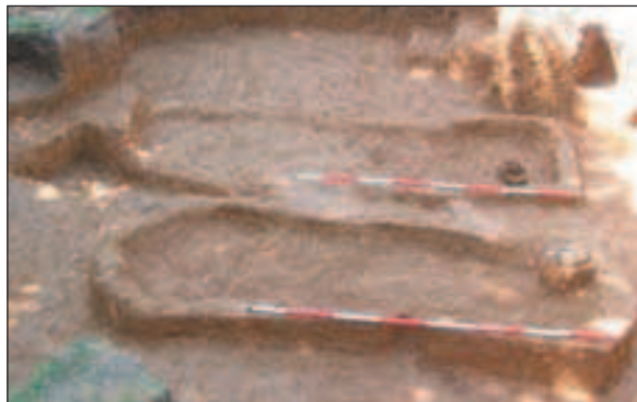
Budinjak, tumul 92

sa šalicom, položen iza nogu pokojnika. Veličina grobne jame upućivala je na grob s bogatijim priložima, ali su pronađeni samo lonac i šalica.