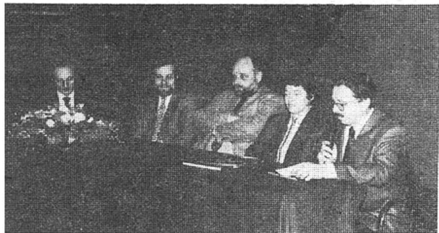
Predstavljanje monografije u Muzeju Grada Zagreba.

Na dan predstavljanja, monografija mogla vidjeti samo u vitrini