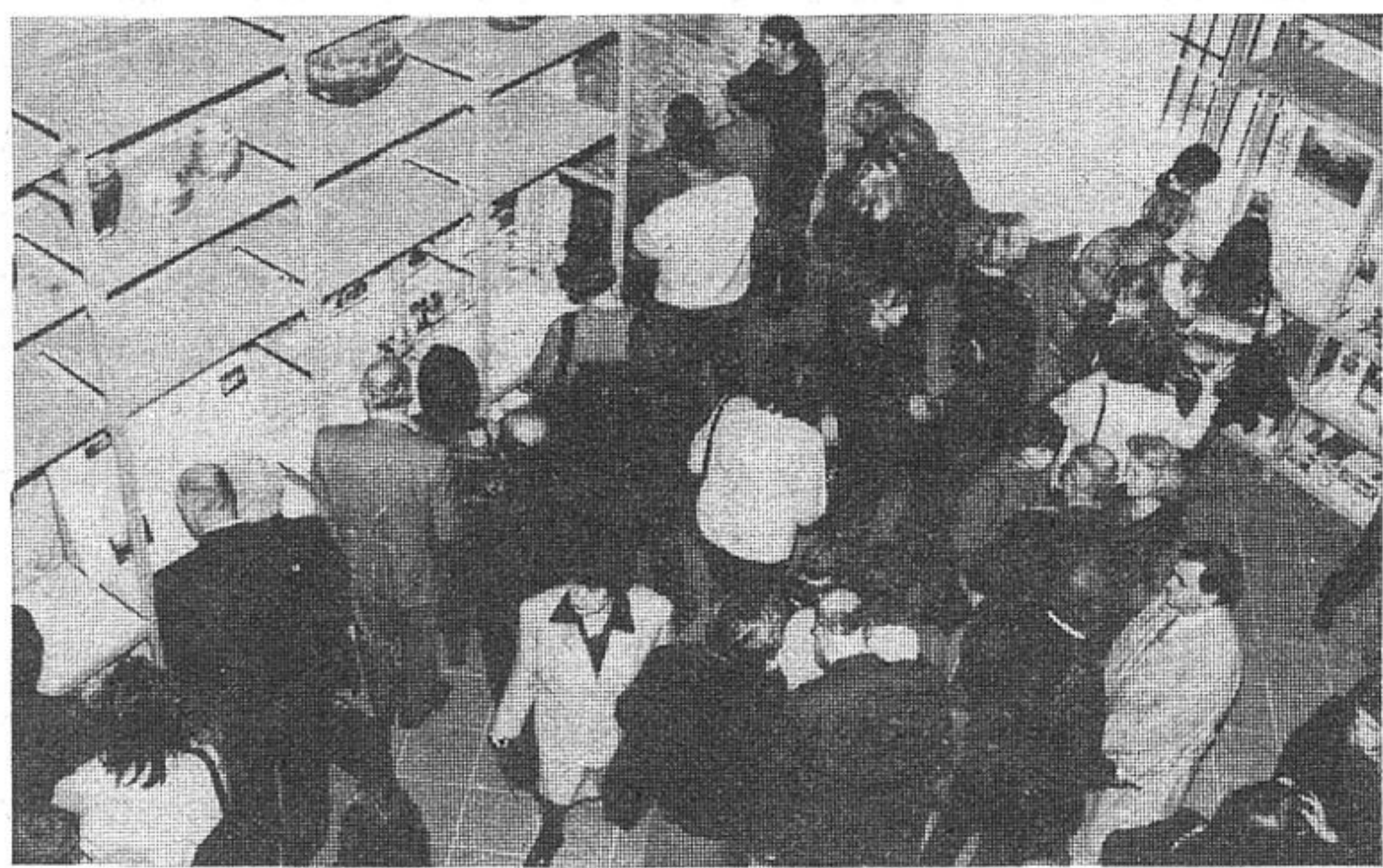
Veliko zanimanje za izložbu »Budinjak – kneževski tumul«