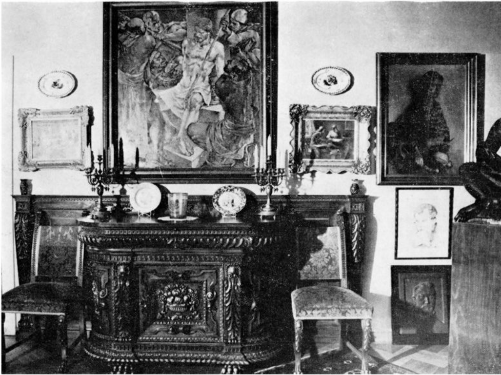
Zbirka umjetnina Zvonimira Pučara