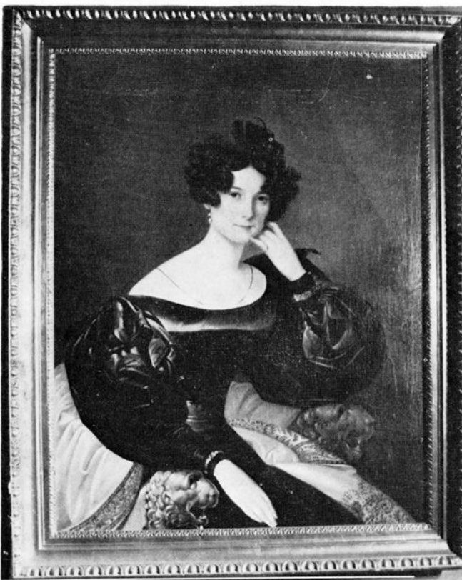
Zbirka Jelačić — Michael Stroy, »Portret grofice Jelačić rođ. Sermage«

Jelačić — Michael Stroy collection »Portrait of the Countess Jelačić, born Sermage«