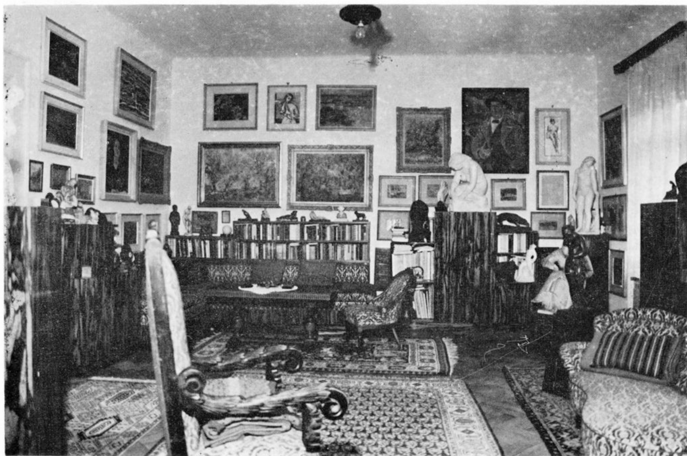
Zbirka Drago Magjer

Prema današnjem uvidu u inventare, zbirke bi se mogle grupirati u dvije osnovne skupine. U jednoj su kulturnopovijesne zbirke s različitim materijalom, od umjetničkih predmeta do dokumentacijske građe vezane uz rad i stvaranje, te život značajnih ličnosti naše sredine. Takve su na primjer zbirke: ostavština dr. Nauma Mallina (hrvatski preporod, osnivanje »Hrvatskog gospodarskog društva«), sada u vlasništvu Nadbiskupskog stola u Zagrebu, zbirka Cate Dujšin-Ribar višeznačnih obilježja, kao memorijalna zbirka dr.