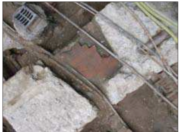
Dio gradskog bedema uz kućni br. Mesnička 23, s naknadno probijenom nišom

Iskopom je ustanovljeno da sjeverni zid današnjeg kućnog br. 14 leži na gradskom bedemu, čiji se temelj prema zapadu proteže koso u odnosu na današnju ulicu. Bilo je zorno vidljivo kako je temelj bedema oštećen recentnim ukopavanjem komunalnih instalacija, a najviše je devastiran izgradnjom opečne, nadsvođene kanalizacije otkopane u zapadnom rubu sonde. Te su instalacije većinom još uvijek u funkciji, a kako ne bi bile oštećene iskop je zaustavljen na razini iz koje je bilo moguće iščitati smjer pružanja bedema. Kao i na drugim lokacijama unutar Gornjega grada, potvrđeno je da je bedem građen od nepravilno pritesanih kamenih blokova položenih na