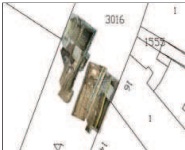
Arheološke sonde u Mesničkoj ulici

Sonda na Markovićevu trgu otvorena je pokraj zgrade Državnoga hidrometeorološkog zavoda, uz istočni ugao njezina sjeverna pročelja. Riječ je o trgu omeđenome navedenom zgradom Zavoda (s juga), palačom Zrinski na kućnom br. 3 (sa sjevera), zgradom Grič 2 (sa zapada) te kućom Vranicanijeva 6 (s istoka). Bitno je napomenuti kako se istočno krilo zgrade Državnoga hidrometeorološkog zavoda nalazi iznad kapele Uznesenja Marijina, koja se vidi na tlocrtu tog dijela grada iz 1766. godine. Pozicija arheološke sonde određena je s ciljem da se prilikom istraživanja ustanove temelji pročelja te dio zapadnog i