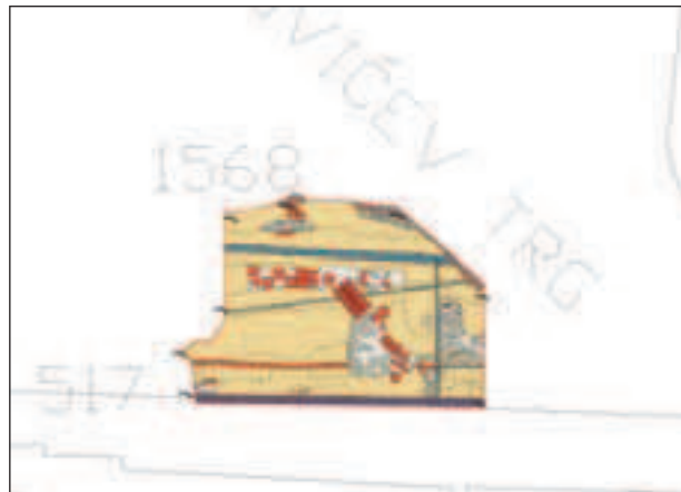
Pozicija arheološke sonde na Trgu Franje Markovića (crtao: N. Metikoš; obrada: S. Latinović)

istočnog zida kapele Uznesenja Marijina. Na nacrtu iz 1766. zorno se razabire kako sjeverno pročelje kapele zadire u prostor današnjeg Markovićeva trga, što je i uvjetovalo njegov tlocrtni izgled. Naime, iz tlocrta je vidljivo kako prilikom gradnje palače Zrinskih nije bilo dovoljno prostora za gradnju južnoga (glavnog) pročelja zgrade u liniji s ostalim kućama u Vranicanijevoj ulici, pa je njegovim povlačenjem prema sjeveru trg zadobio pravilan četvrtast izgled kakav ima i danas.