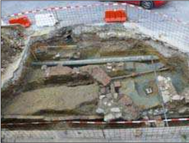
Arheološka sonda na Trgu Franje Markovića

na 155,45 m n.m., a u zapadnom na 156,61 m n.m. Riječ je o svega 75 cm ispod razine današnjeg pločnika uz Državni hidrometeorološki zavod. Nekadašnje kameno popločenje trga nalazi se tridesetak centimetara ispod današnje razine trga na 156,29 m n.m., te je zbog svega toga nužan arheološki nadzor bilo kakvih komunalnih radova na tom prostoru.