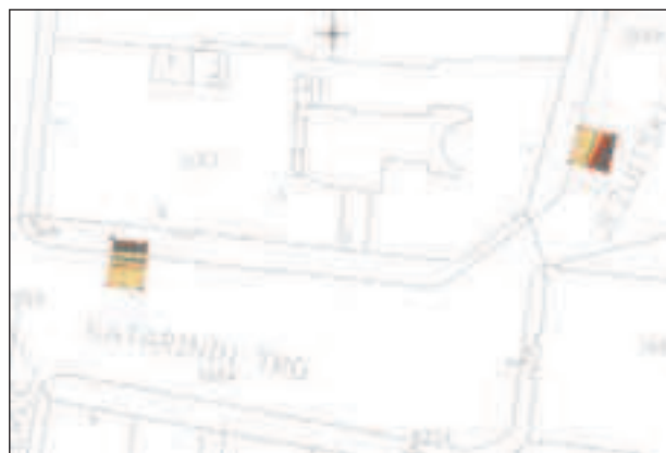
Pozicija arheoloških sondi na Trgu Katarine Zrinske i Jezuitskom trgu (crtao: N. Metikoš; obrada: S. Latinović)

Dakle, arheološka sonda na Markovićevu trgu upućuje na postojanje ostataka zidane arhitekture pod današnjim pločnikom. U istočnom dijelu sonde ti su zidovi sačuvani