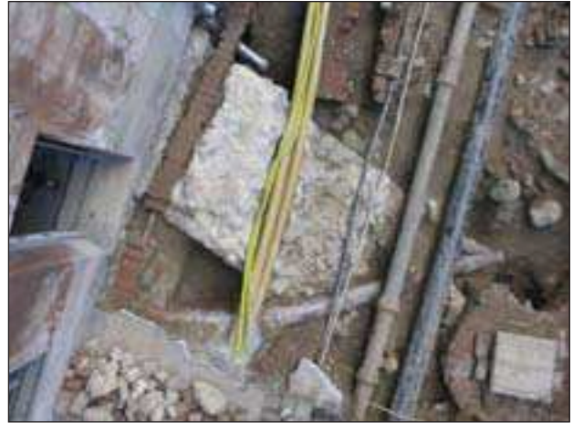
Arheološka sonda s ostacima gradskog bedema ispred kućnog br. Mesnička 14

U Mesničkoj ulici otvorene su dvije sonde – jedna ispred kućnih brojeva 16 i 14, na istočnoj strani, a druga na dijelu ulice južno od prostora ispred kućnog br. 23. Pozicije su odabrane shodno prikazu na akvarelu Ludovika Bužana iz 1792., na kojem su vidljiva Mesnička vrata neposredno uz kapelu sv. Ivana Nepomuka. Kapela se nalazila na mjestu današnjega kućnog br. 12. Na istom akvarelu vidljivo je