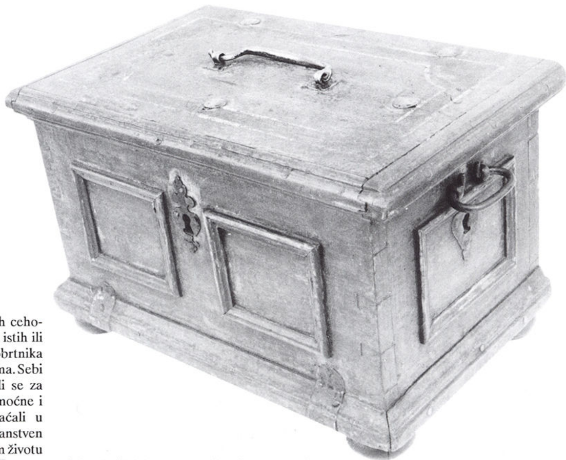
Cehovska škrinja kaptolskih čohaša, 17. stoljeće.

U cehove su se udruživali obrtnici koji su podmirivali temeljne potrebe zagrebačkih žitelja. Bili su to: krojači, postolari, čizmari, tkalci, gumbari, klobučari i mesari; zatim obrtnici metalske struke: kovači, bravari, srebrnari (zlata-ri), mačari, ostrugari i kopljari; te obrtnici kožarske struke: krznari, uzdari i remenari. Obrtnici koji su se brinuli za higijenu i zdravlje, bili su: brijači (kirur-