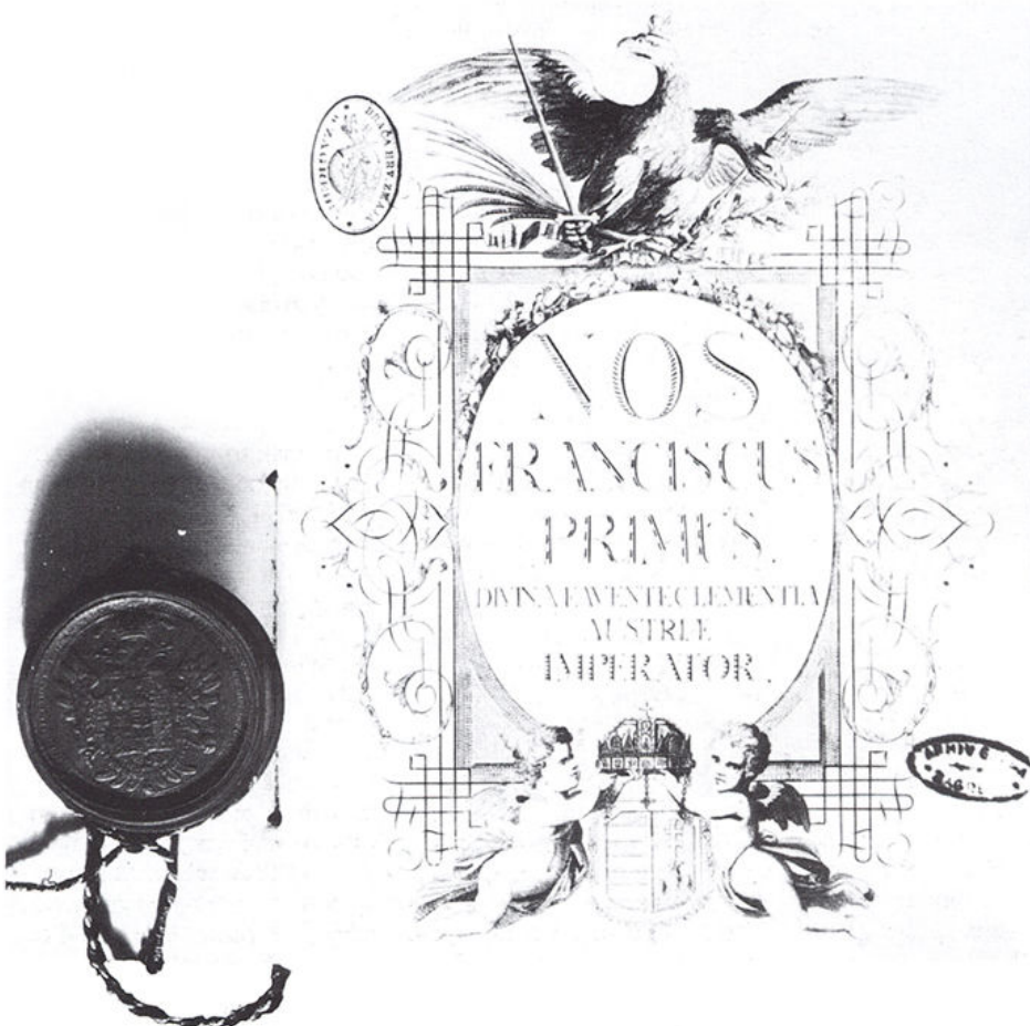
Privilegij Franje I izdan cehu klobučara, Beč 3. VIII 1818.